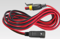
Erweiterungen 2.5 m - 029057